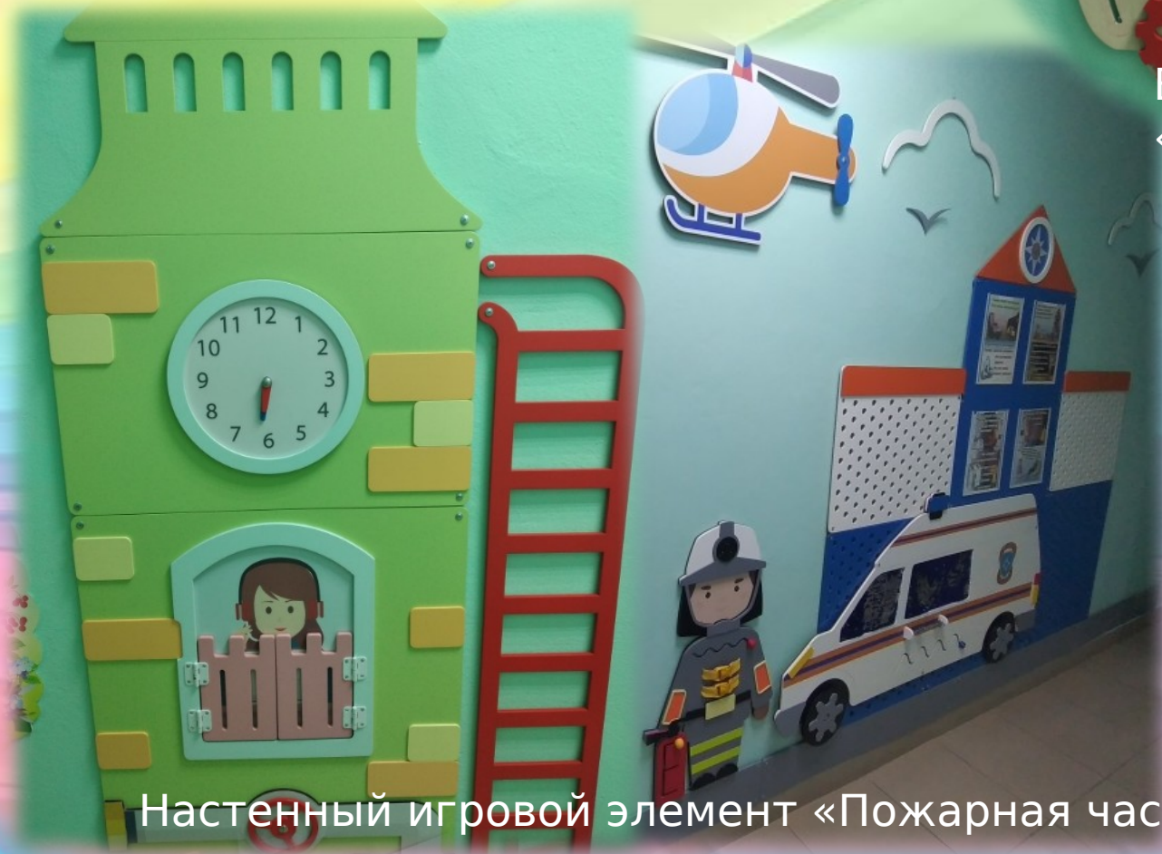
Настенный игровой элемент «Пожарная часть»