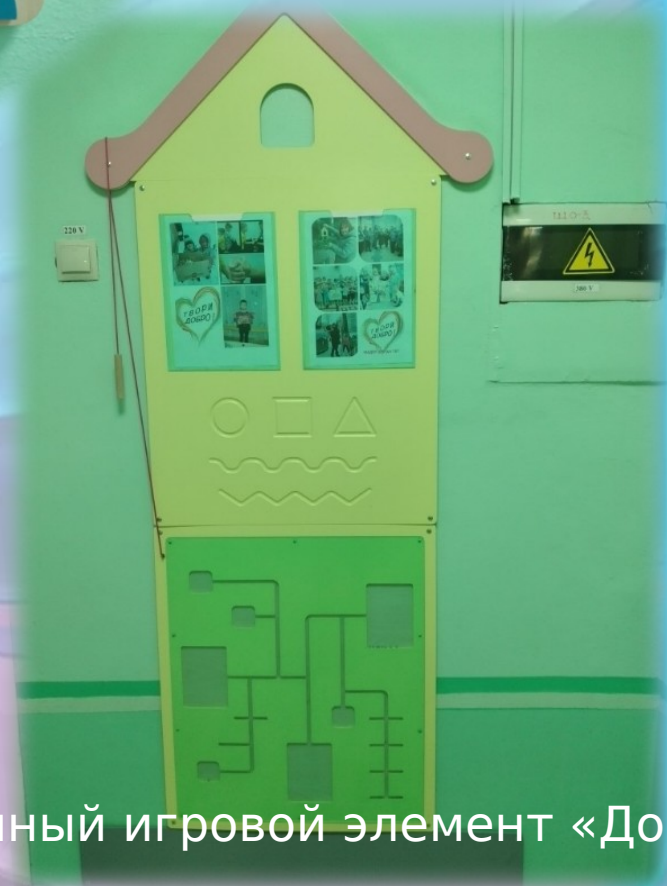
Настенный игровой элемент «Дом».