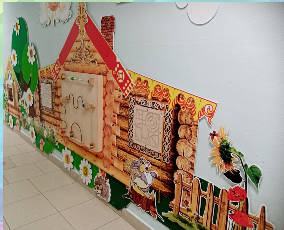
Бизиборды «Магнитный лабиринт», «Сенсорный домик», «Девять зеркал»