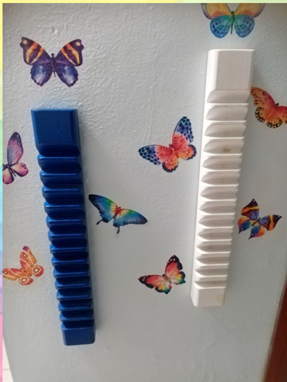
«Тренажёры для пальчиковых игр»