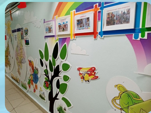
Развивающее панно «Моя Россия»