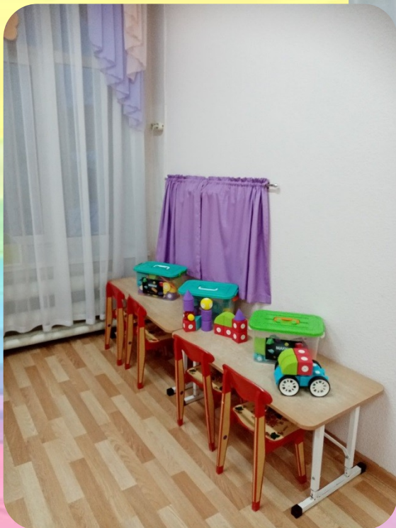
Кабинет дополнительного образования