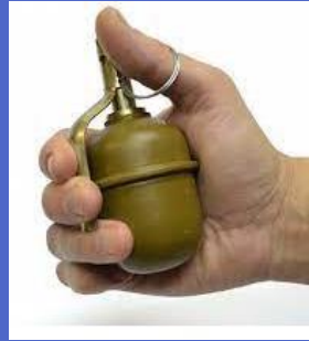
Граната Ф-1 - 200 м